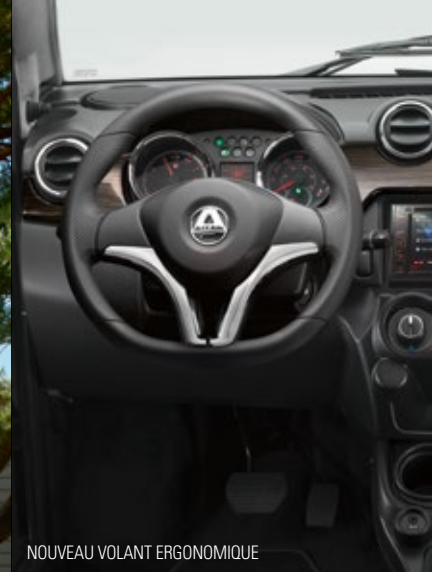
NOUVEAU VOLANT ERGONOMIQUE