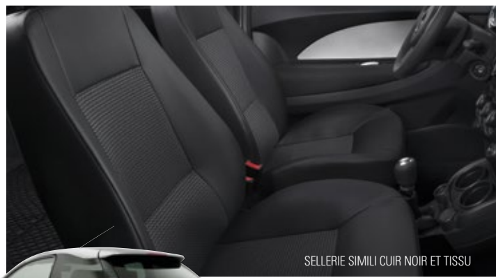
SELLERIE SIMILI CUIR NOIR ET TISSU