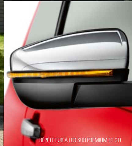
RÉPÉTITEUR À LED SUR PREMIUM ET GTI