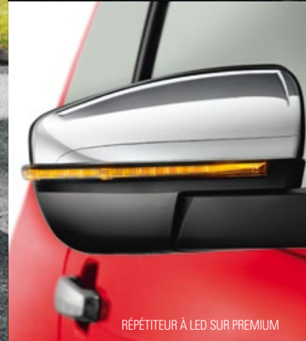
RÉPÉTITEUR À LED SUR PREMIUM