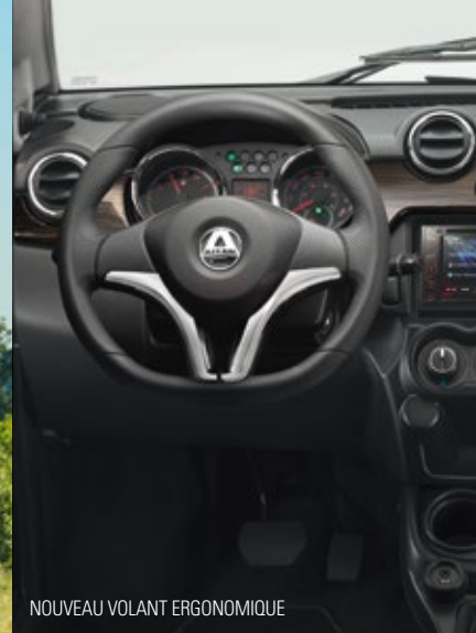
NOUVEAU VOLANT ERGONOMIQUE