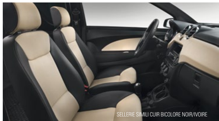
SELLERIE SIMILI CUIR BICOLORE NOIR/IVOIRE